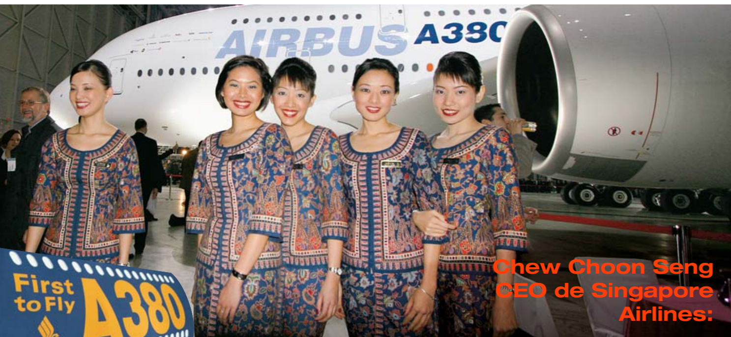
Chew Choon Seng CEO de Singapore Airlines:

A mediados de 2006 volará el primer A380 de Singapore Airlines cubriendo la línea entre Londres, Singapur y Australia