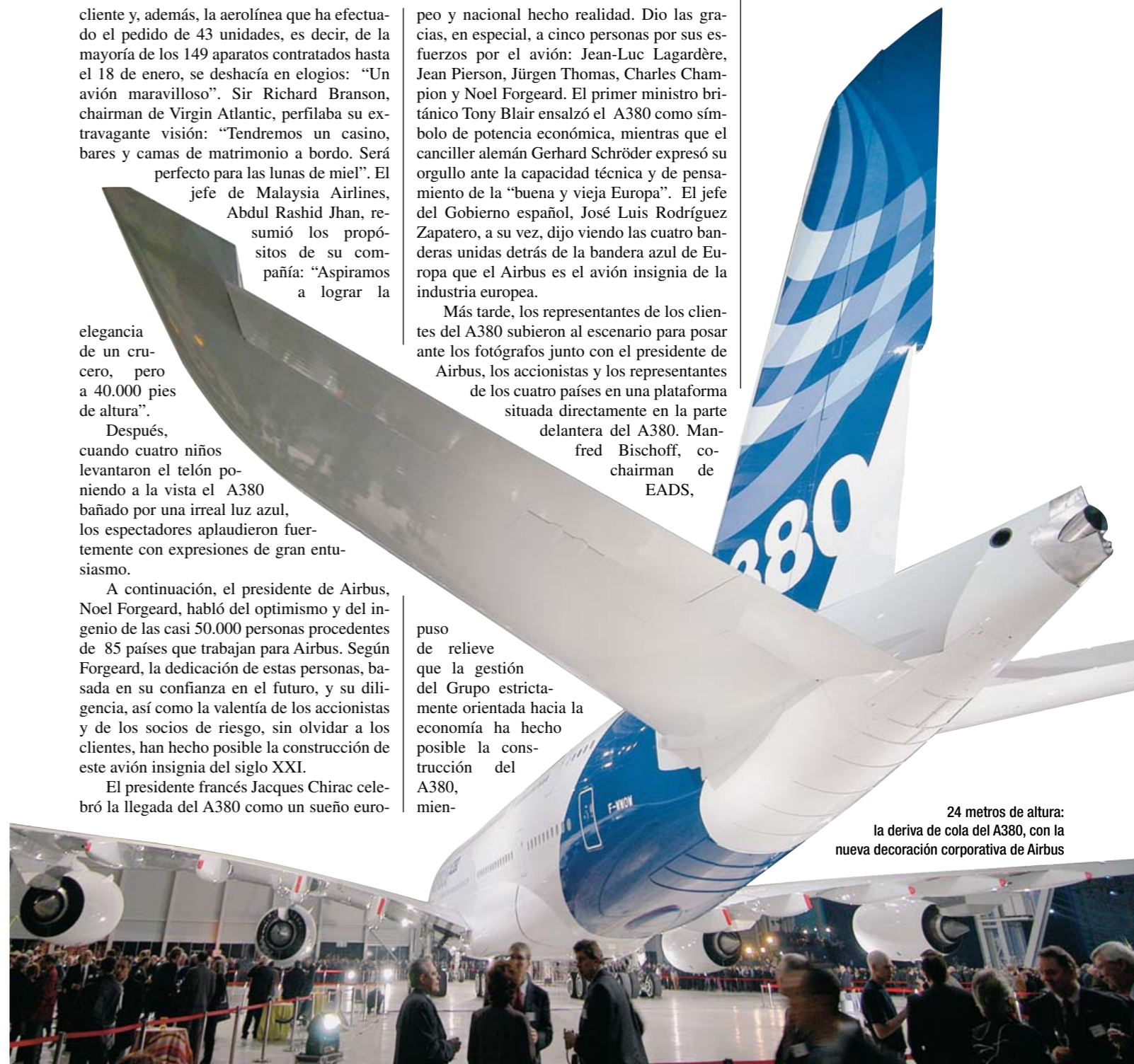
24 metros de altura: la deriva de cola del A380, con la nueva decoración corporativa de Airbus

tras que Richard Olver, chairman de BAE Systems, resaltó los estrechos lazos de la asociación. Sin embargo, quien de manera más acertada describió el acontecimiento fue el co-chairman de EADS, Arnoud Lagardère. Al pulsar el botón para llevar a cabo el “bautismo de luz” del A380 dijo simplemente: “Hoy es un día maravilloso”.