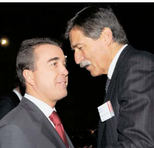
Les deux coprésidents de EADS lors du dévoilement de l'A380 : Arnaud Lagardère et Manfred Bischoff