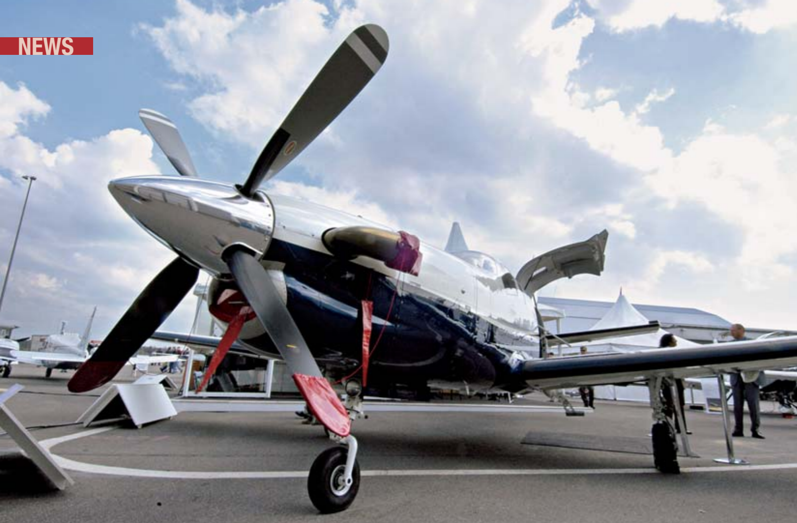
El TBM 700 de Socata, el más veloz monomotor turbohélice del mundo gracias a su velocidad de crucero de 300 nudos.