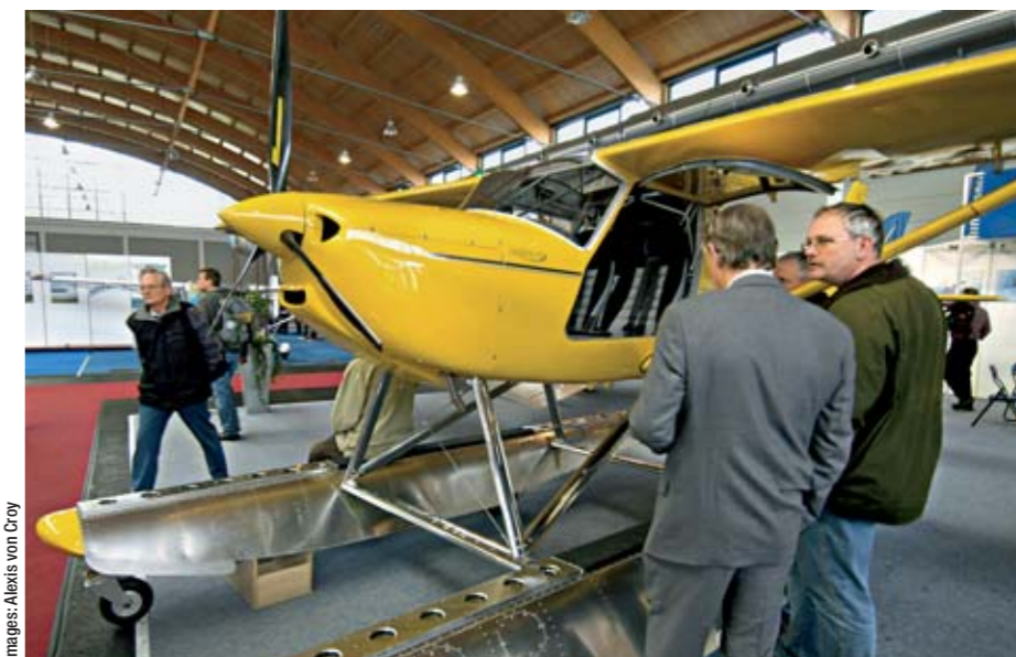
Ultraligero FK9, equipado con motor de Smart, un aparato extraordinariamente silencioso y respetuoso con el medio ambiente gracias a su catalizador.